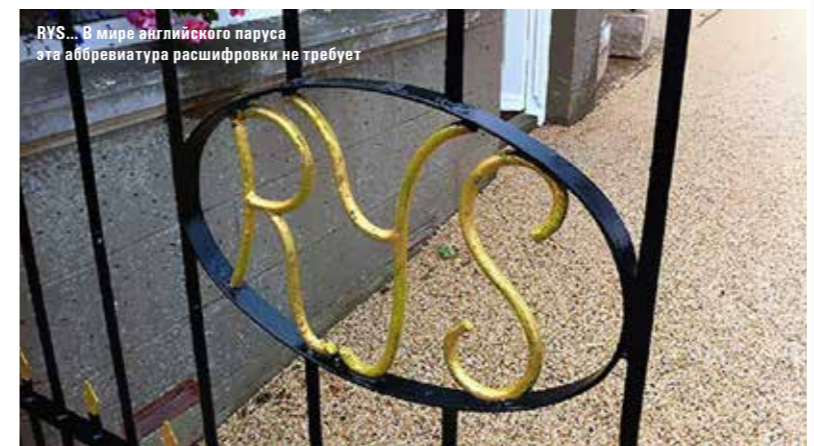
RYS... В мире английского паруса эта аббревиатура расшифровки не требует

За двести лет мир вокруг изменился до неузнаваемости, яхты стали быстрее и доступнее, новые технологии облегчили навигацию и жизнь на воде, неизменным осталось лишь одно чувство, объединившее 42 джентльмена в 1815 году и объединяющее миллионы людей по всему миру сегодня, – любовь к парусу. 🚩