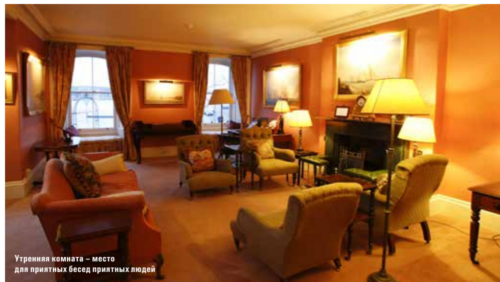
Утренняя комната – место для приятных бесед приятных людей

Поражение английских яхт в «битве» со шхуной «Америка» в 1851 году до сих пор не просто досадный эпизод в истории клуба, но по выражению одной из его адмиралов «незаживающей раной». И слова королевы Виктории, наблюдавшей за гонкой из своей резиденции на острове Уайт и увидевшей лишь яхту американцев: «А где же остальные?» по-прежнему болезненны для членов клуба – так же, как давний ответ первого лорда Адмиралтейства: «А остальных нет». Попытки вернуть Кубок «Америки» на родину предпринимались неоднократно, и всякий раз заканчивались неудачей. Может, сэру Бену Эйнсли удастся сделать это? Члены ROYAL YACHT SQUADRON очень на это надеются. Тогда они будут счастливы.