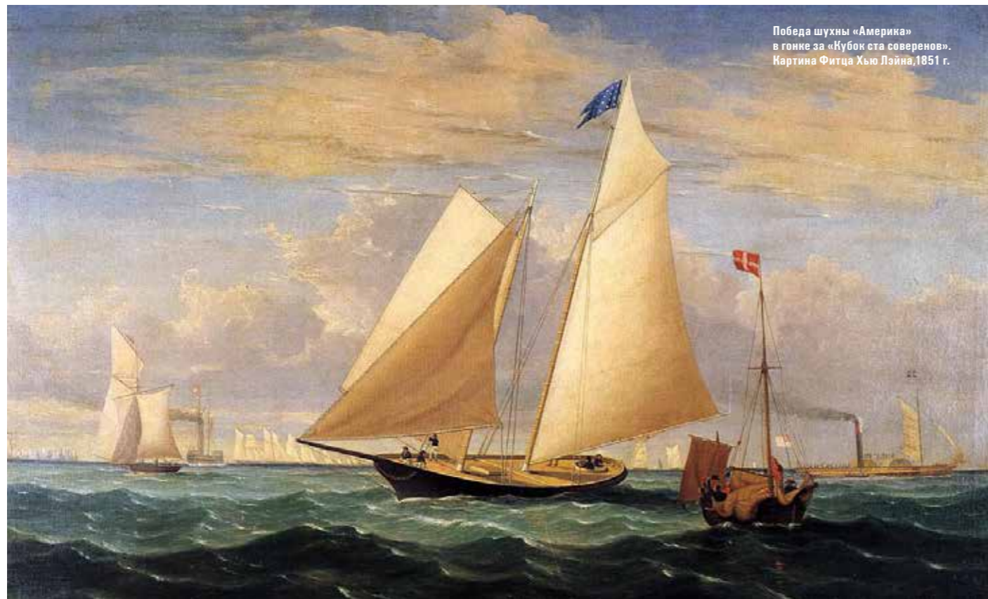
Победа шхуны «Америка» в гонке за «Кубок ста соверенов». Картина Фитца Хью Лэйна, 1851 г.

Поражение английских яхт в «битве» со шхуной «Америка» в 1851 году до сих пор не просто досадный эпизод в истории клуба, но по выражению одной из его адмиралов «незаживающей раной». И слова королевы Виктории, наблюдавшей за гонкой из своей резиденции на острове Уайт и увидевшей лишь яхту американцев: «А где же остальные?» по-прежнему болезненны для членов клуба – так же, как давний ответ первого лорда Адмиралтейства: «А остальных нет». Попытки вернуть Кубок «Америки» на родину предпринимались неоднократно, и всякий раз заканчивались неудачей. Может, сэру Бену Эйнсли удастся сделать это? Члены ROYAL YACHT SQUADRON очень на это надеются. Тогда они будут счастливы.