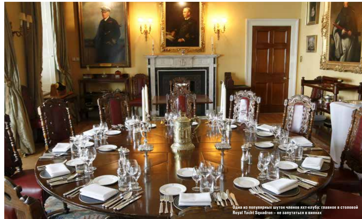
Одна из популярных шуток членов яхт-клуба: главное в столовой Royal Yacht Squadron – не запутаться в вилках

Сам «Замок» славится своим роскошным интерьером и множеством исторических артефактов, достойных экспозиции любого музея. Однако полюбоваться на интерьер можно только при соблюдении строгого дресс-кода: костюм и галстук обязательны, обут каждый уважающий себя яхтсмен должен быть в кожаную поношенную – это считается отличительно чертой настоящего морского волка. Здесь же, в этих стенах, родилась традиция надевать на клубные мероприятия вместе с синим блейзером красные брюки, которые теперь во всем мире так и называются – coves trousers. Доподлинная история проникновения красного цвета в мир парусной моды остается неизвестной, но большинство исследователей связывают этот цвет с так называемыми «траулерами Бриксхэма» – рыболовецкими судами, в изобилии строившимися в Девоншире в XIX веке, отличавшимися, с одной стороны, своей ходкостью (что сделало их образцом для подражания для многих яхтенных конструкторов той эпохи), а с