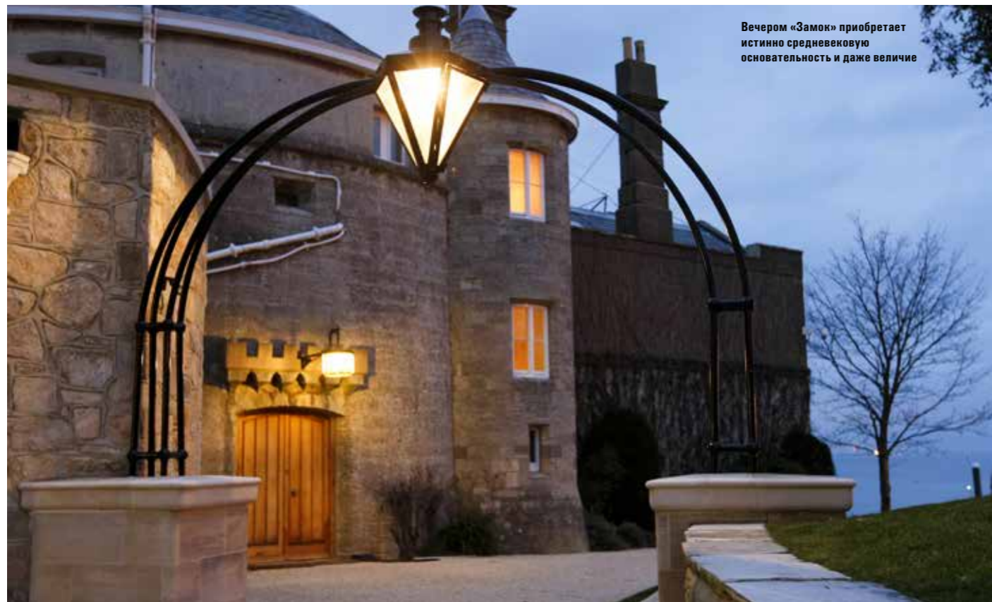
Вечером «Замок» приобретает истинно средневековую основательность и даже величие

Royal Yacht Squadron – место аристократическое. К разного рода новациям здесь относятся с осторожностью и скепсисом. Куда дороже членам клуба здоровый консерватизм, и все в клубе свидетельствует об этом – и сам вид «Замка», и его интерьеры, и медь пушек, и золоченый штурвал, слепящий изысканной роскошью гостей клуба. Так этот клуб и был задуман, как заведение в высшей степени элитарное, доступное лишь избранным – тем, кто ценит истинные ценности, которые имеют замечательную особенность – не меняться со временем