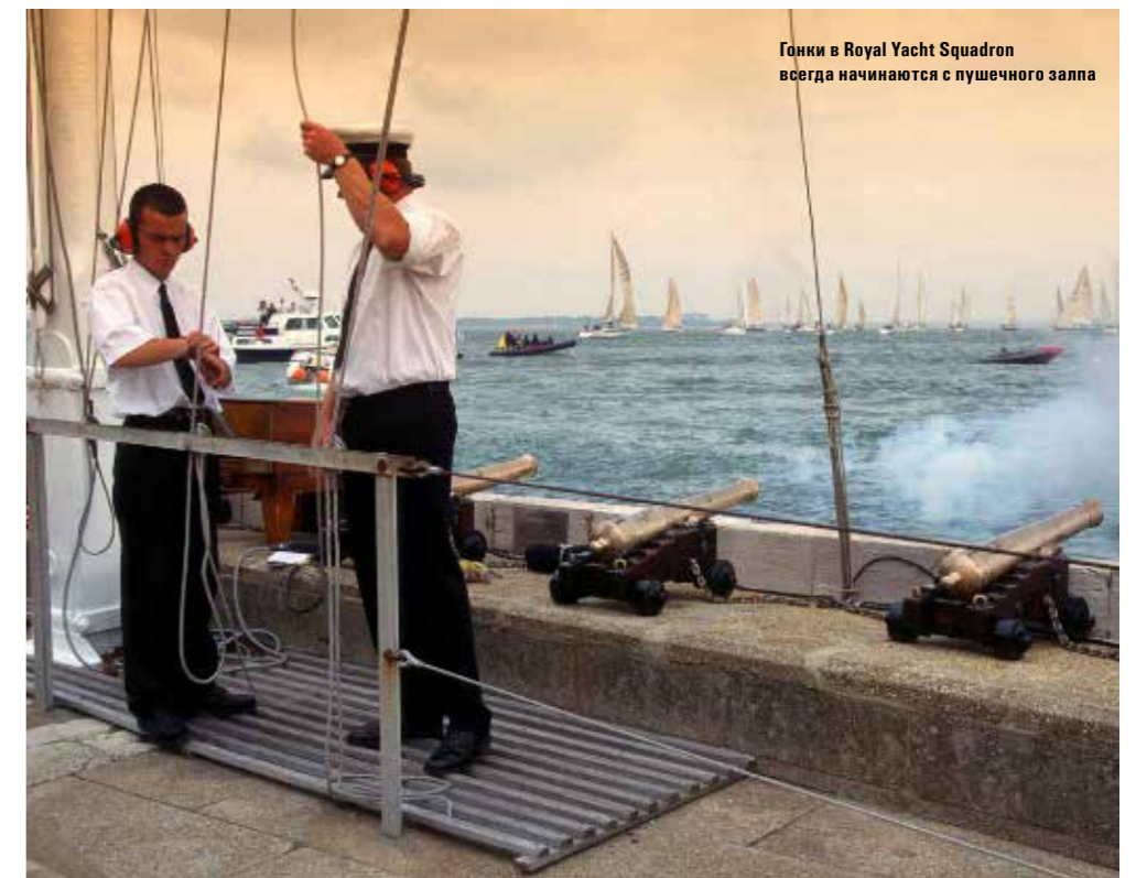
Гонки в Royal Yacht Squadron всегда начинаются с пушечного залпа

Последним крупным «обновлением» стало открытие в 2000 году так называемого павильона на лужайке перед «Замком». Это элегантное сооружение, спроектированное сэром Томасом Крофтом, позволило значительно расширить доступное яхтсменам и их семьям место для отдыха и общения, сохраняя при этом аристократическую эстетику основных помещений «Замка». Здесь члены клуба могут отобедать в непринужденной обстановке или просто насладиться фантастическим видом на Солент – про-