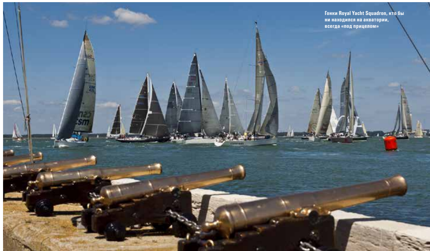
Гонки Royal Yacht Squadron, кто бы ни находился на акватории, всегда «под прицелом»

WHITE ENSIGN стал единственным официальным британским военно-морским флагом в 1864 году. До этого было три флага – BLUE, WHITE и RED ENSIGN – по числу эскадр в Королевском военно-морском флоте. В своем последнем бою адмирал Нельсон командовал эскадрой, сражавшейся под белым знаменем, им же его друг адмирал Томас Харди (впоследствии почетный член ROYAL SQUADRON) укрыл тело покойного моряка. Именно этот факт и стал, как утверждается, основанием для решения даровать членам клуба право поднимать WHITE ENSIGN на своих судах. А чтобы еще более подчеркнуть неразрывную связь яхтсменов и военных моряков, в название клуба появилось слово SQUADRON (ЭСКАДРА)