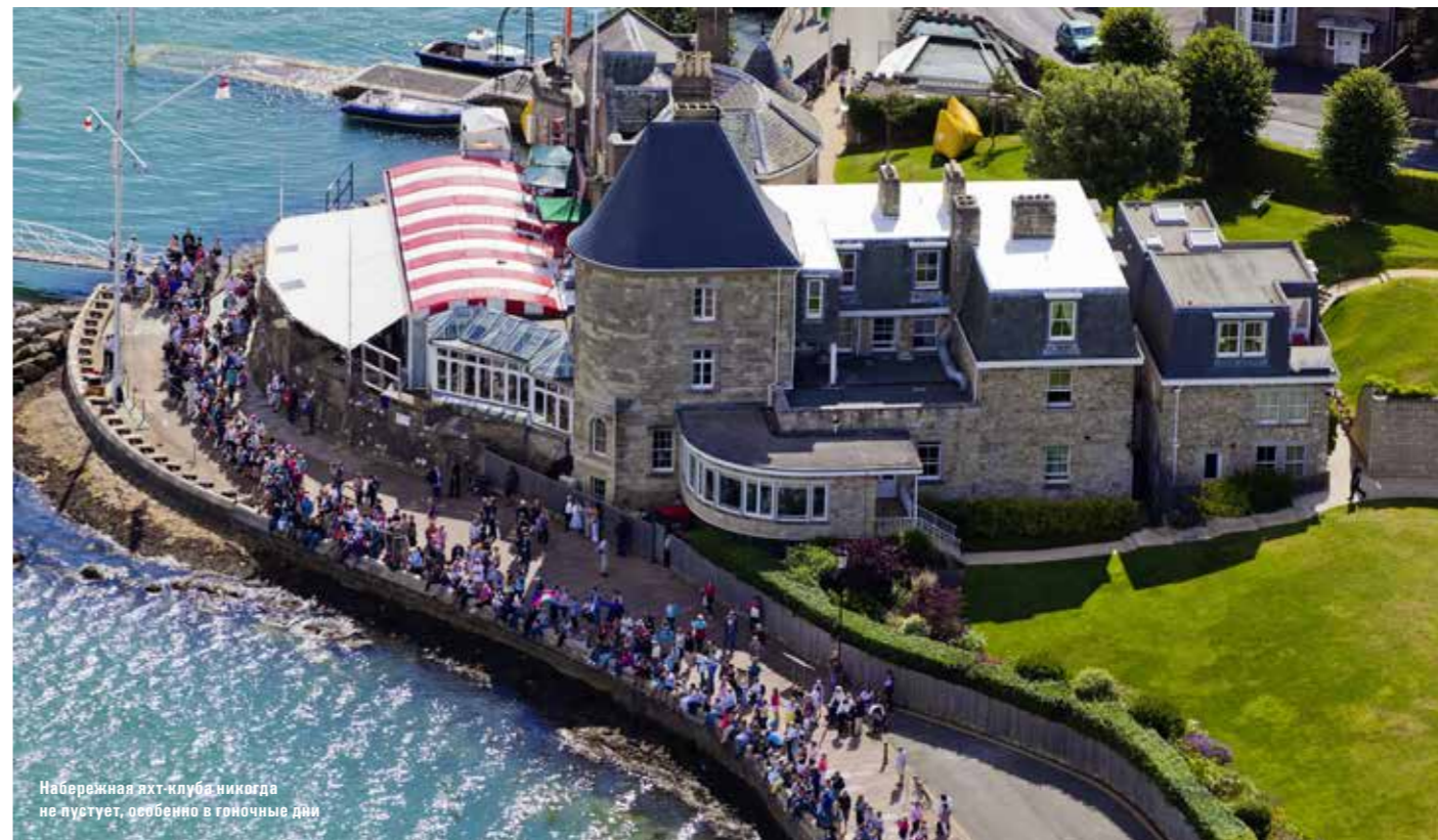
Набережная яхт-клуба никогда не пустует, особенно в гоночные дни

не имеет права стоять рядом или прикасаться к ней!