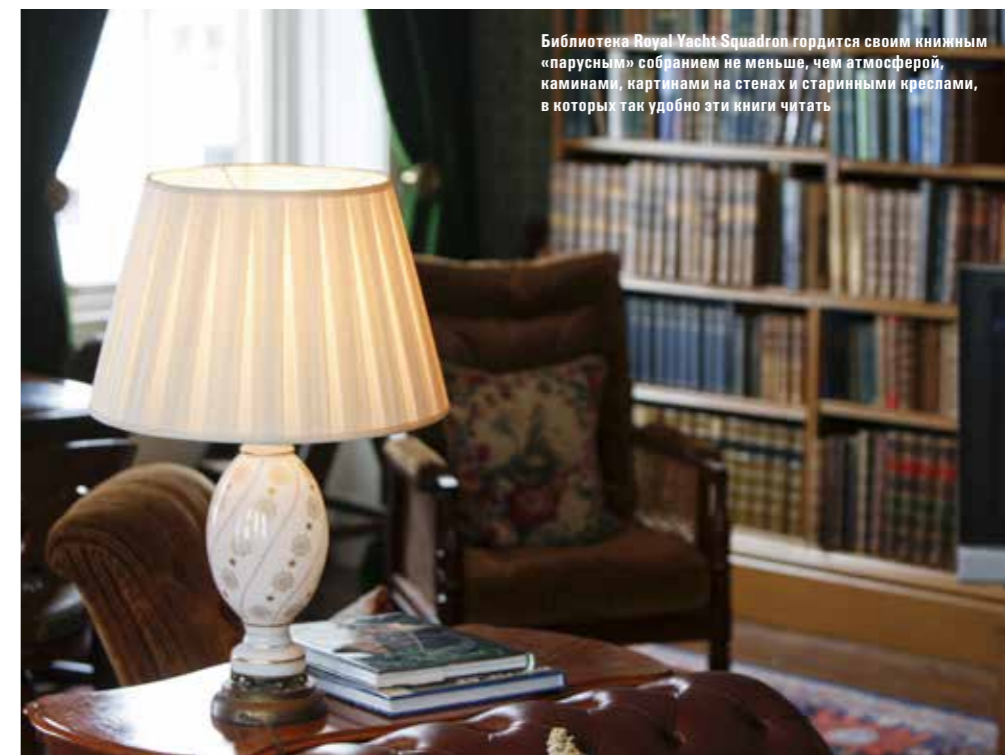
Библиотека Royal Yacht Squadron гордится своим книжным «парусным» собранием не меньше, чем атмосферой, каминными, картинами на стенах и старинными креслами, в которых так удобно эти книги читать

Начиная с Георга IV, королевская семья не оставляет своим вниманием яхт-клуб в Соленте. Его первым адмиралом стал король Вильгельм IV. Большое участие в судьбе клуба приняла королева Виктория, так же внимательны были короли Георг V и Эдуард VII. Ныне покровительницей клуба является королева Елизавета II, а ее муж принц Филипп – его адмиралом.