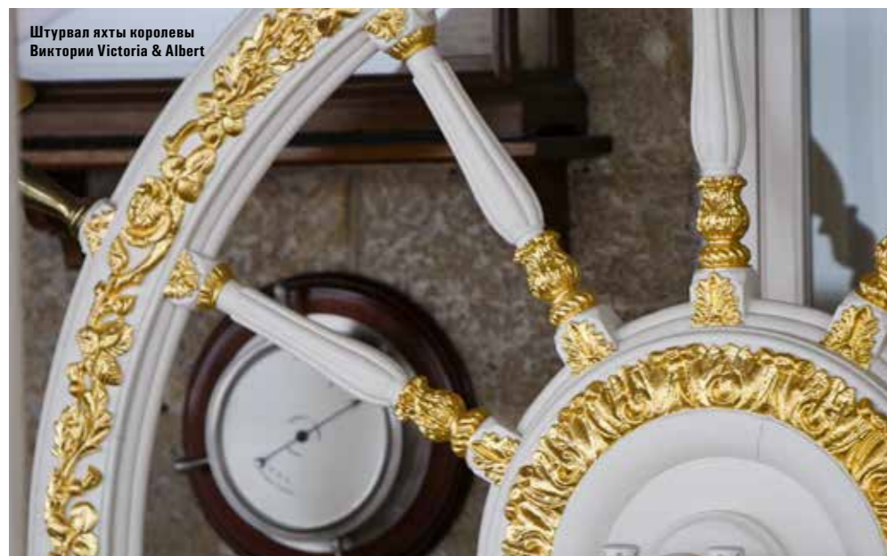
Штурвал яхты королевы Виктории Victoria & Albert

Royal Yacht Squadron – место аристократическое. К разного рода новациям здесь относятся с осторожностью и скепсисом. Куда дороже членам клуба здоровый консерватизм, и все в клубе свидетельствует об этом – и сам вид «Замка», и его интерьеры, и медь пушек, и золоченый штурвал, слепящий изысканной роскошью гостей клуба. Так этот клуб и был задуман, как заведение в высшей степени элитарное, доступное лишь избранным – тем, кто ценит истинные ценности, которые имеют замечательную особенность – не меняться со временем