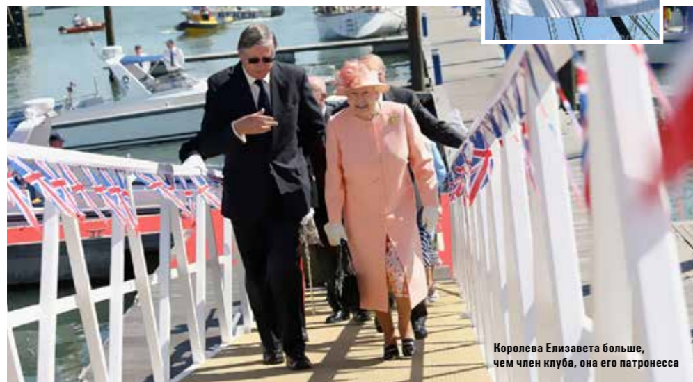
Королева Елизавета больше, чем член клуба, она его патронесса

Члены клуба и их гости, которые хотят задержаться в «Замке» на несколько дней, могут воспользоваться одним из 15 номеров, в том числе престижной Комнатой коммодора**.